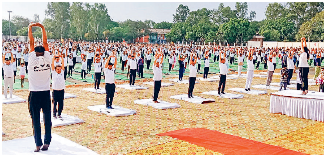
भिवानी। योग दिवस पर भीम स्टेडियम में योग करते हुए। भिवानी के भीम स्टेडियम में प्रदेश के वित्त मंत्री जय प्रकाश दलाल ने योग दिवस का शुभारंभ किया।