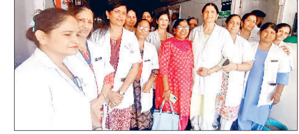
भिवानी। लंबित मांगों को लेकर एकत्रित नर्सिंग ऑफिसर।