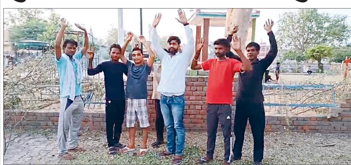
भवानीखेड़ा। पार्क की समस्याओं को लेकर नारेबाजी करते हुए।