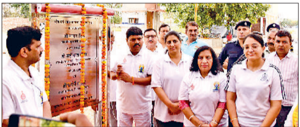
भिवानी। योगशाला का उद्घाटन करते राज्यमंत्री विशम्बर बाल्मीकि।

प्रधानमंत्री नरेंद्र मोदी ने भारतीय योग पद्धति को वैश्विक स्तर पर नई पहचान दिलाने का ऐतिहासिक कार्य किया है। अंतरराष्ट्रीय योग दिवस पर भारतीयों के साथ साथ दुनियाभर में लोग भारतीय योग पद्धति का अभ्यास कर रहे हैं।